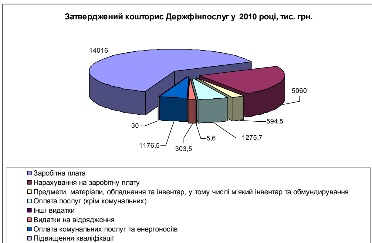
Рис. 3. Затверджений кошторис Держфінпослуг у 2010 р.

За видатками „Оплата праці” у 2010 році виділено і фактично профінансовано асигнування на суму 14016,0 тис.грн. Середня заробітна плата працівників Держфінпослуг становила 4358 грн., (у 2009 році – 3875 грн.). Заборгованості із заробітної плати та інших соціальних виплат немає.