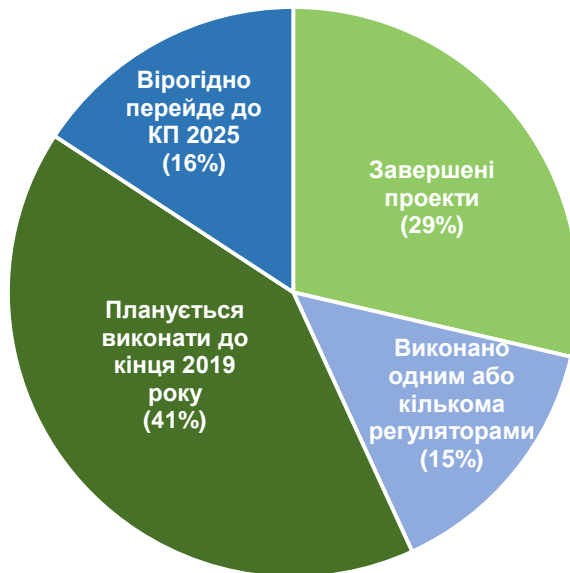
Статус реалізації проектів КП 2020